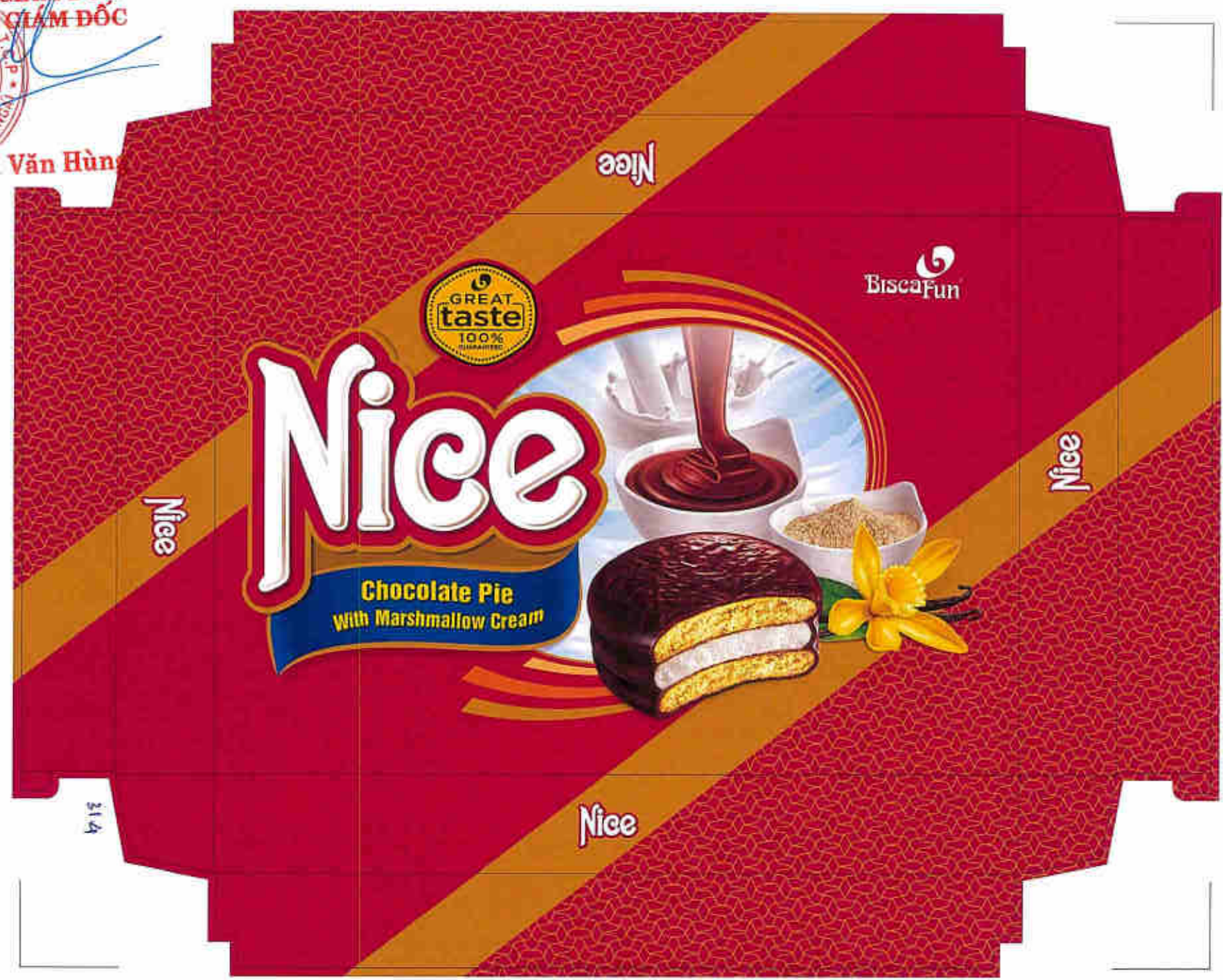
BCF-298A-NX_Nắp hộp quà Nice 450g_Chính ND mail 25.12.20(T)