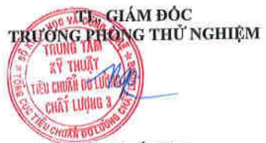
Ngô Quốc Việt