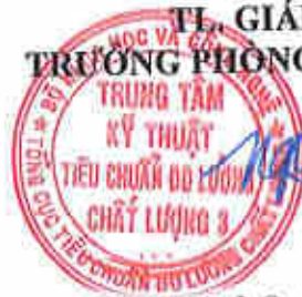
Ngô Quốc Việt