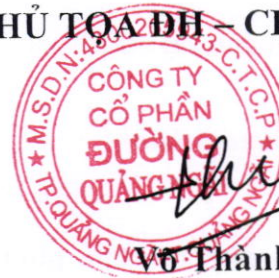
Võ Thành Đàng